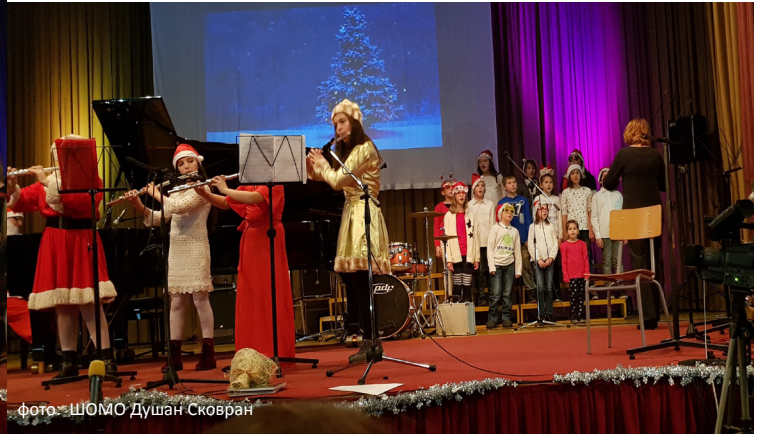
фото: ШОМО Душан Сковран