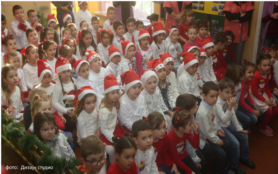
фото: Дизајн студио